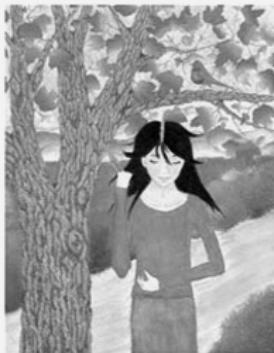
I closed my eyes and breathed in the lightly fragrant aroma of its leaves