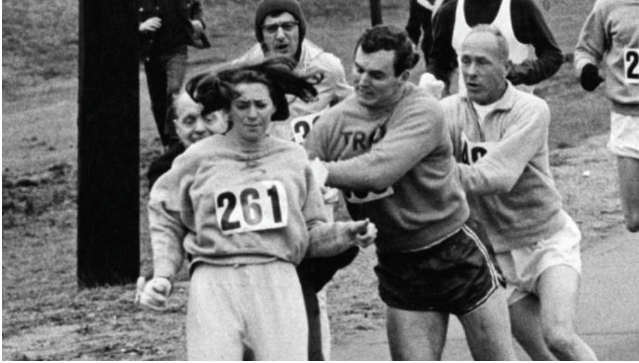
1967, Yalnızca erkeklerin yarıştığı Boston Maratonu'nda koşan ilk kadın Kathrine Switzer'in yakalanışı

Kathrine Switzer, Boston Maratonu'na erkek ismiyle kaydolmuştur ama sonrasında organizatörlerin bunu fark etmesiyle yarıştan kovulmuştur. O anı gösteren, şu anda gördüğünüz fotoğraf benim için çok önemlidir. Bu durum, kadınların maraton tarihinde çok önemli bir olaydır. Kadınlar maratona resmi olarak 1972'de, bu olaydan sonra dahil edilmeye başlandı. Spor tarihine baktığımızda, kadınların spor alanında hem bireysel hem örgütlü olarak farklı pozisyonlarda var olmaya çalıştıklarını görüyoruz. Bu kişilerden bazıları çok önemli isimlerdir. Örneğin Alice Milliat, kadınların modern olimpiyatlara dahil edilmesi için mücadele vermiş bir kürekçidir.