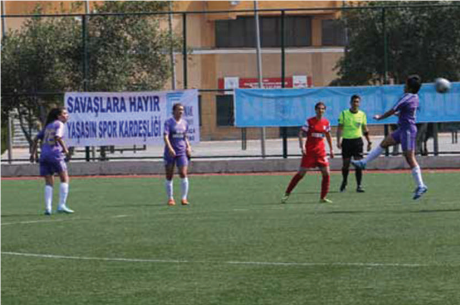
Şubat 2017, Konak Mülteci Meclisi üyeleri ve Suriyeli mültecilerin taraftar olarak katıldığı Konak Belediyespor Kadın Futbol Takımı maçı

Bir diğer konumuz, kadın futbolu. Program içerisinde kadın futboluyla ilgili güzel oturumlar ve sunumlar olacak. Biz 2002 yılında İzmir’de kurulduk. Dernek olarak kurulduğumuz günden beri Konak Belediyespor Kadın Futbol Takımı’nın maçlarını tribünde takip ediyoruz. Bu takım, 4 yıl üst üste şampiyon oldu ve bu sene yine Beşiktaş’la şampiyonluğu kovalıyor. Belki de ülkemizin spor anlamında en başarılı takımlarındandır. Salonda kadın futbol takımıyla ilgilenenler dışında bu takımın varlığından haberi olmayan çok insan vardır. Bu takımın her maçına gidiyoruz ve tribünlerdeyiz fakat kadınları tribünlerde çok az görüyoruz. Kadın futbolunda erkekleri de çok az görüyoruz. Kadın bedeni üzerinden üretilen cinsel şiddet diliyle mücadele ederken,