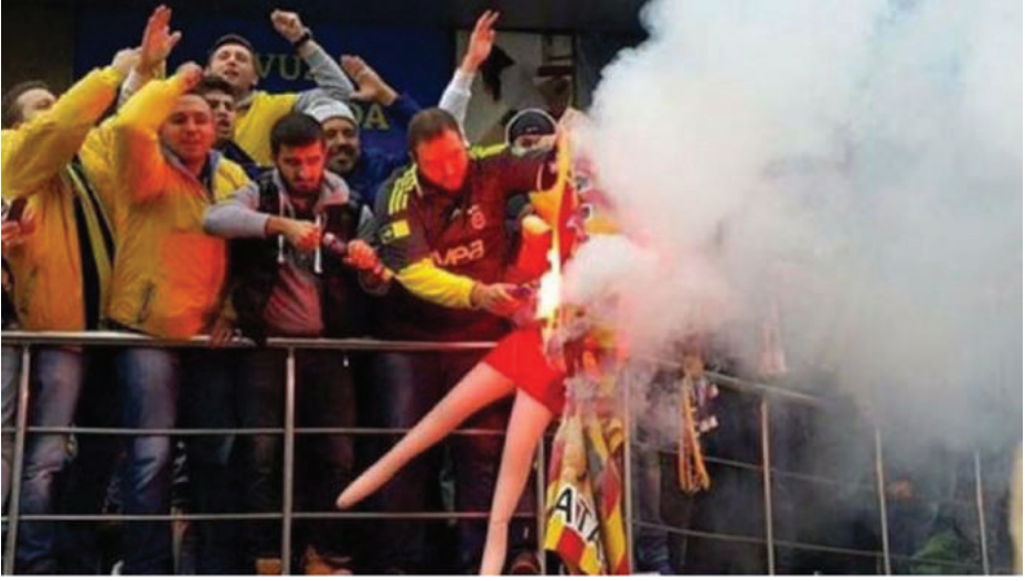
25 Ekim 2015, Galatasaray ve Fenerbahçe maçı şişme bebek yakılırken

inanılmaz bir tepki oluştu. Birçok avukat-tan destek alarak bir şikâyet dilekçesi yazdım. Savcılık, bu olayla ilgili kendiliğinden soruşturma başlatmış. Biz bunu sonradan öğrendik.