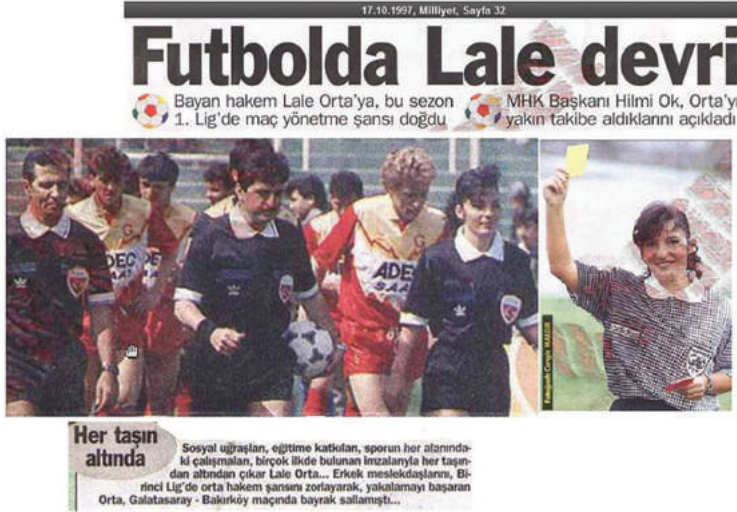
17.10.1997 tarihli Milliyet gazetesi haberi