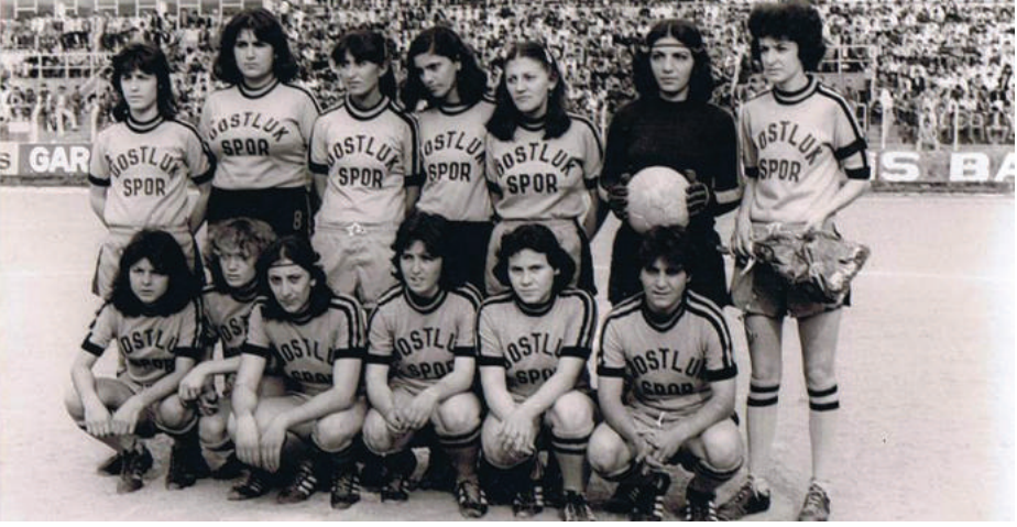
1979. Ünye Stadi, Dostluk Spor Kız Futbol Takımı'nın maç öncesi seremonisi

daha fazla antrenman yaparak kapatmaya çalıştım. Kişinin yaptığı işteki kabiliyeti, yeterliliği ve yetkinliği; cinsiyetten öte, kendi yapısıyla ilgilidir. Tamamen sizinle özdeşleşen bir durumdur. Eğer yaptığınız işin içine kendinizi oturtabiliyorsanız; kendi kimliğinizi, kişiliğinizi ona uygun bulabiliyorsanız, başarabiliyorsunuz. Ne yazık ki Türkiye'de 'Ne güzel hakem olmuşsun, biz de seni bekliyorduk. Sana yolları açalım. Bu işte yürü, ilerle.' gibi bir durumla karşılaşmadım. Birçok şeyi adeta tırnaklarımla kazıyarak, çok çalışarak, hep çalışarak gerçekleştirdim. Sürekli olarak erkeklere kıyasla daha fazla sınıandım.