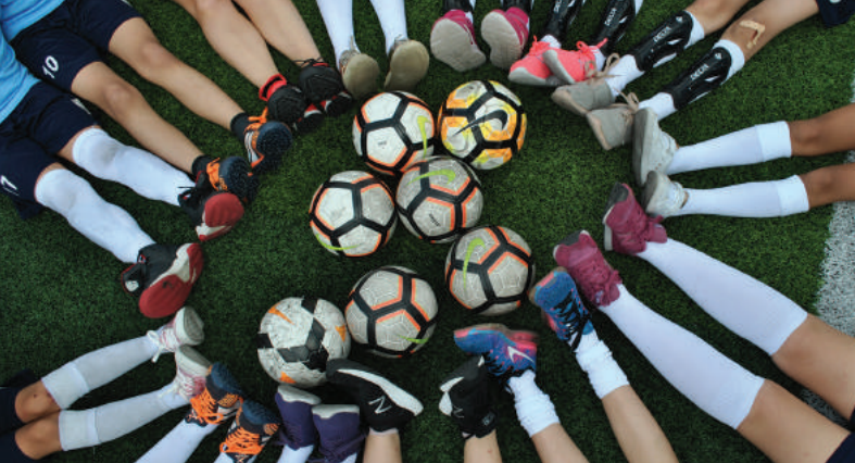
Kızlar Sahada antrenmanlarından

settim. Erkekler de bizim oynayıp oynamayacağımıza bakmak için halı sahaya gelmişlerdi. Normalde çok hırslı bir insan değilimdir. Maçta bir anda kendimden geçmiştim ve önümdeki kıza çelme takıyordum; kazanmak için elimden gelenin yüzde yüzünü ortaya koyuyordum. Fark ettim ki bunu kendim için olmadığından yapabiliyorum. Takım arkamda olduğu için o hırslı sahaya koyabilmişim. Bu durum bende inanılmaz bir dönüşüm başlattı. Hırslı olmamak ve hırslımı göstermemek, liseden bu yana öğrendiğim bir davranıştı. Hırslı olmanın hep utanç verici bir şey olduğunu düşünmüştüm. O gece bütün hırslım dışarı çıkınca, kendime ‘Ben bunu neden yapıyorum?’ diye sordum ve arkasında takım ruhunun dönüştürücü gücünün olduğunu fark ettim. Kızlar Sahada zaten bu deneyimle başladı. O kadar hırs ve tutku diyorum; lakin hırs ve tutku pek bir işe yaramadı. Biz o maçta 6-2 yenildik. Fakat bunu bir turnuva haline getirip bütün kadınlara ulaştırmak istedik. Ben işin bu tarafıyla ilgileniyorum. Kızlar Sahada , şu an bir kadın futbol platformudur. Bu platformun bizi en çok ilgilendiren ve heyecanlandıran kısmı, futbolu sevdirmekten ziyade futbolu bir araç olarak