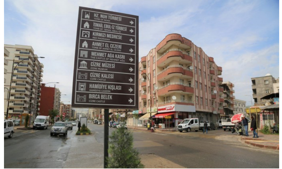
Cizre Belediyesi kayyımı kentteki tabelalarda Kürtçe'ye yer vermedi.

► Siirt Belediyesine kayyım olarak atanan