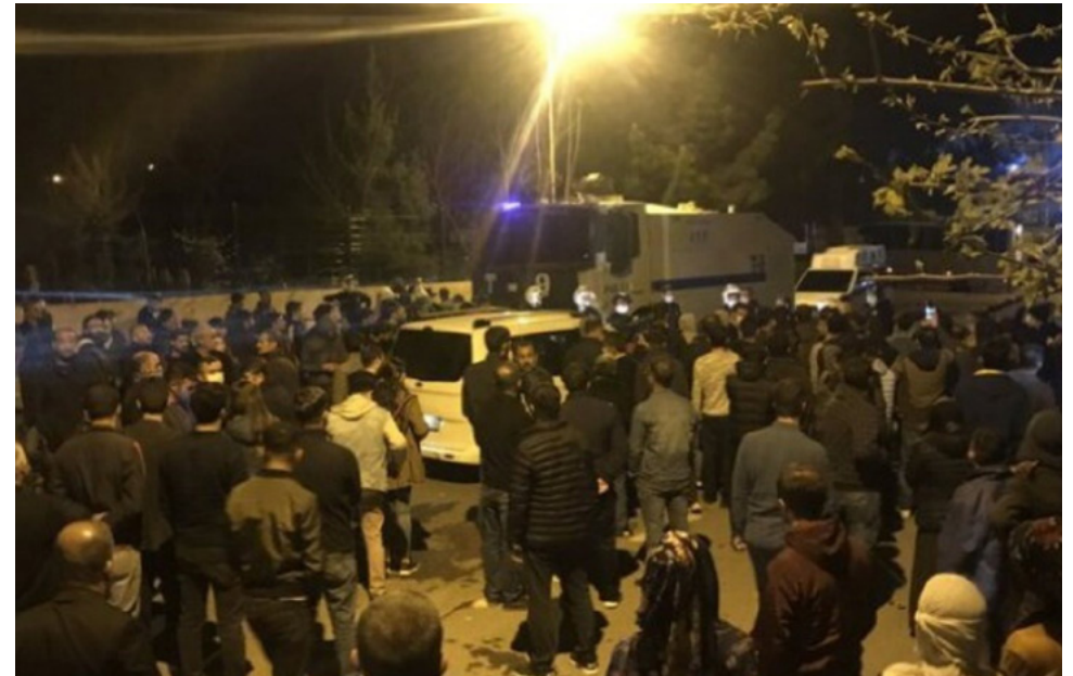
Batman M Tipi Cezaevinde isyan çıktı.

■ HDP Grup Başkanvekilleri Meral Daniş Beştaş ve Saruhan Oluç, cezaevlerinde yeni tip koronavirüs salgınının yayılım hızına bağlı olarak toplu ölümlerin yaşanmaması için mevcut durumun tespiti ve alınacak önlemlerin belirlenmesi amacıyla TBMM'de araştırma komisyonu kurulmasını talep etti. Önerge reddedildi. (14 Nisan)