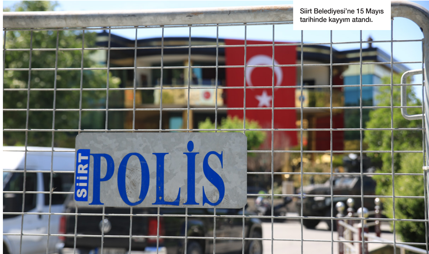
Siirt Belediyesi'ne 15 Mayıs tarihinde kayyım atandı.

► HDP yönetiminde bulunan Batman, Diyarbakır Silvan, Lice, Eğil ve Ergani, İğdır Halfeli, Siirt Gökçebağ, Bitlis Güroymak belediyelerine kayyım atandı. Belediye