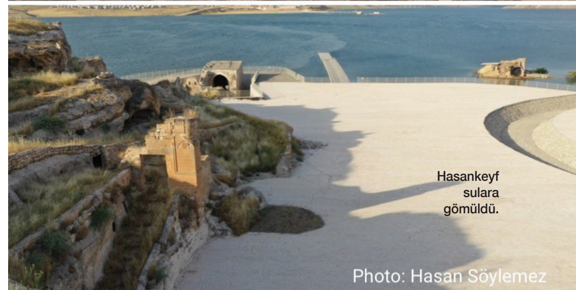
Hasankeyf sulara gömüldü.