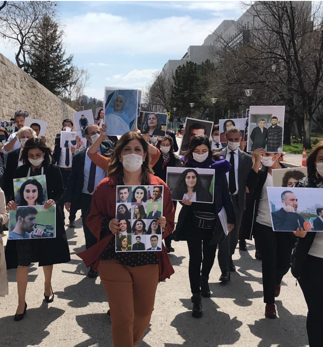
Yandaşlara af getiren İnfaz düzenlemesine karşı HDP'li milletvekilleri TBMM kampüsünde yürüyüş düzenledi.

hasta mahpuslar konusundaki duyarsızlığı nedeniyle salgın sürecinde çeşitli cezaevlerinde 3 hasta mahpus yaşamını yitirdi. Telifsiz imkansız sonuçlara sebep olacak ve hala düzelmeyen bu durumdan en çok da düzenli kemoterapi görmesi gereken kanser hastaları etkilendi. Kanser hastaları serbest bırakılmadıkları gibi tedavilerini de sürdüremediler. Aynı şekilde pek çok hasta mahpusun hastane sevkleri de yapılmadı.