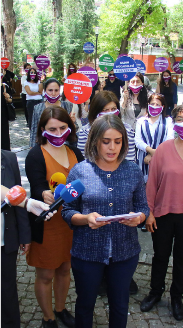
HDP Kadın Meclisi, kadın kazanımlarına dönük saldırılara karşı kampanya başlattı. HDP Milletvekilleri Kuşlupark'ta basın açıklaması yaptı.

Diyarbakır'da ev işçisi kadınlarla yaptığı anket çalışması, kadınların yaşadıkları en temel sorunlarının başında ekonominin geldiğini ortaya koyuyordu. Araştırmaya katılan kadınların hiçbirinin kendilerine ait sağlık sigortaları bulunmazken, yüzde 48'i kendilerinden başka ev ekonomisine katkı sağlayan kimse olmadığını belirtiyordu. Salgın sürecinde Türkiye'de hane içi yoksulluğun kadınların sırtına yüklenmesini engelleyecek hiçbir politika üretilmezken, kayıt dışı çalışan kadınlar iktidarın ekonomik desteklerinden tümüyle mahrum bırakıldı.