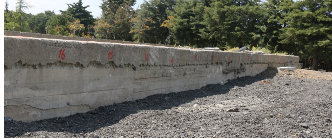
Kilyos'ta bir kaldırımda 261 cenazenin üst üste defnedildiği ortaya çıktı.

■ Dersim'de çıktığı belirtilen bir çatışma sonucu yaşamını yitiren 4 HPG'li'den biri olan Hasan Oruç'un ailesine teşhis için cenaze yerine fotoğraflar gösterildi. Aile, kendilerine gösterilen cenazeyi tanımayacak halde olduğu için teşhis edemedi. Bunun üzerine DNA testi için aileden kan örneği alındı. (10 Haziran)