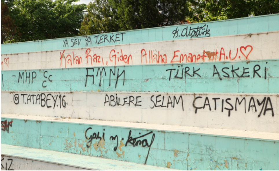
Ekin Ceren Kadın Parkı, kayyım tarafından TÜGVA'ya kiralandı.

yerlerine kayyım atanan HDP'li belediye eşbaşkanlarının da aralarında bulunduğu 10 kişi, tutuklama istemiyle sevk edildikleri mahkemece "adli kontrol" ve "ev hapsi" şartlarıyla serbest bırakıldı. (19 Mayıs)