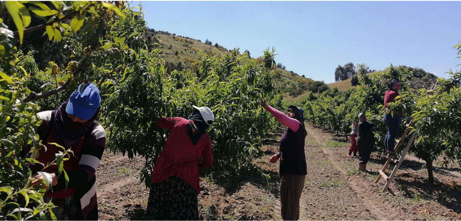
Mevsimlik işçiler / Fotoğraf: Esra Solin Dalma

■ HDP Tarım Komisyonu Mart ayında "Koronavirüs Günlerinde Tarım" ve Nisan ayında "Neoliberalizm Kısacasında Gıda Rejimi" bültenleri yayınladı. Bültenlerde salgın döneminde tarım alanında yaşanan sorunlar ve çözüm önerileri masaya yatırıldı; tüm dünya halklarının tüketmek zorunda kaldığı sağlıksız gıdalara karşı pandemi sürecinde doğal beslenme yolları ve alternatif bir gıda rejiminin oluşturulması konusunda örnekler sunuldu. (Mart - Nisan)