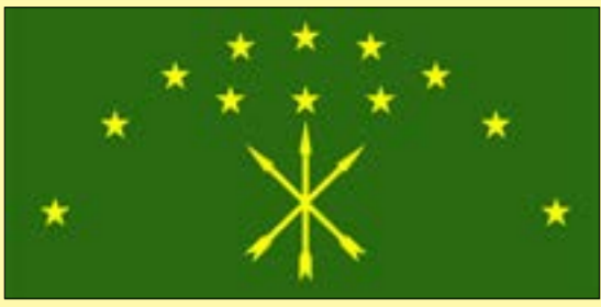
МЭЗАИМЫ 21 ДУНАЙ НЫБЗЭМ ИМАФЭ. УИНЫБЗЭ ХЪУМЭЖЬ.