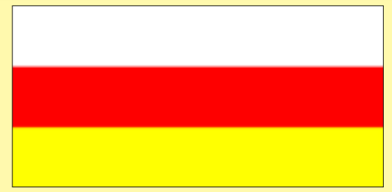
ЕРТХЪИРАЕНЫ МАЕЙ 21. ДАЕ МАДАЕЛОН АЕВЗАГЫЛ ФИДАР ХАЕЦ.