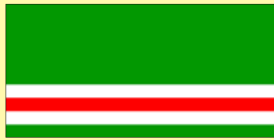
21-ГИА ФЕВРАЛЬ - ДУЬНЕНАЮКЪАРА НЕНАН МЕТТАН ДЕ ДУ. НЕНАН МОТТ ХААР - ДОЗАЛЛА ДУ!