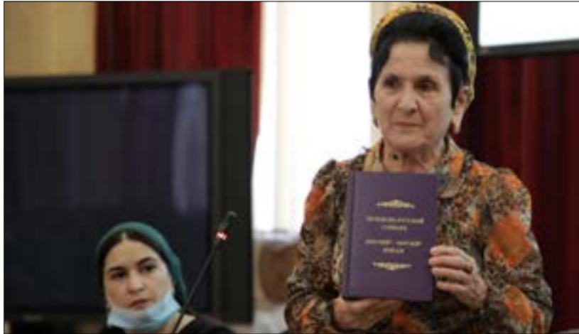
кхетча вуно дика хир дара.