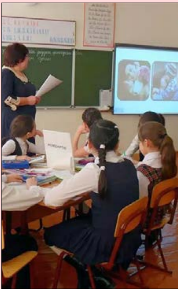
ахуыргæнджытæм, цæмæй сæм уыдон дæр сæхи цæстангасæй æркæсой. Уый фæстæ сæ хъæудзæн мыхуыры рауадзын.

-Программæ æмæ ахуыргæнæн чингуыты уавæр афтæ рауадис, æмæ фыццаг цæттæгонд æрцыдысты кыуыри 4-5 сахаты пайда кæнынмæ. Уый фæстæ федералон стандарт аивта, æмæ дзы маделон аевзагæн базад æрмæст æртæ сахаты. Афтæмæй та чингуытæ мыхуыры рапыдысты æмæ скъолатæм æрвыст æрцыдысты. Ныртаккæ автортæ бакуыстой программæ æмæ чингуытыл, фæхуымагæтæдæр сæ кодтой, стæй сæ 'рмæджытæ фæкыддæр кодтой, цæмæй сын æртæ сахаты мидæг сахуыр кæнынаг фадат уа. Ныр та сæ ратдзыстæм скъолаты