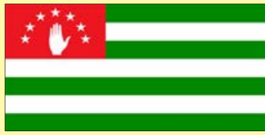
ЗЫШӨКӨЫР 21, АДУНЕИ ХАТӨЫБЫЗШӨА АМШ. УХАТӨЫБЫЗШӨА УАГЪШӨМАХА.