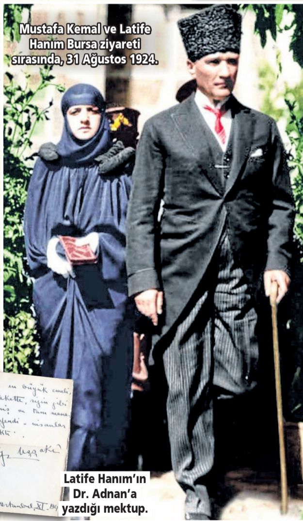
Mustafa Kemal ve Latife Hanım Bursa ziyareti sırasında, 31 Ağustos 1924.